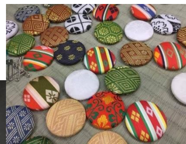
畳の縁でアクセサリ作り