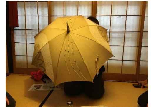
京鹿の子絞りの傘!