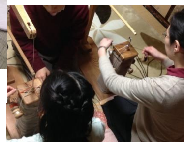
組紐キーホルダー作り