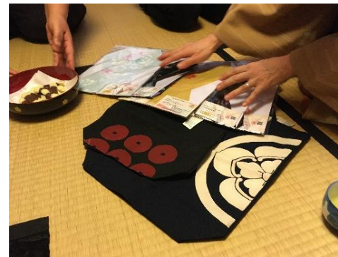
家紋をデザインしたエコバッグ(ご本人は友禪伝統工芸士)