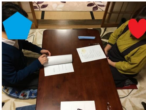
京都人度チェック挑戦中♪

組紐体験・お抹茶体験のあと、それぞれの方が担っておられる伝統工芸や伝統芸能の披露をしていただき、それぞれの苦勞や問題点など自由にトークしていただきました。みなさんプロフェッショナルなので、それぞれがそれぞれの技や芸に驚くことしきりでした!